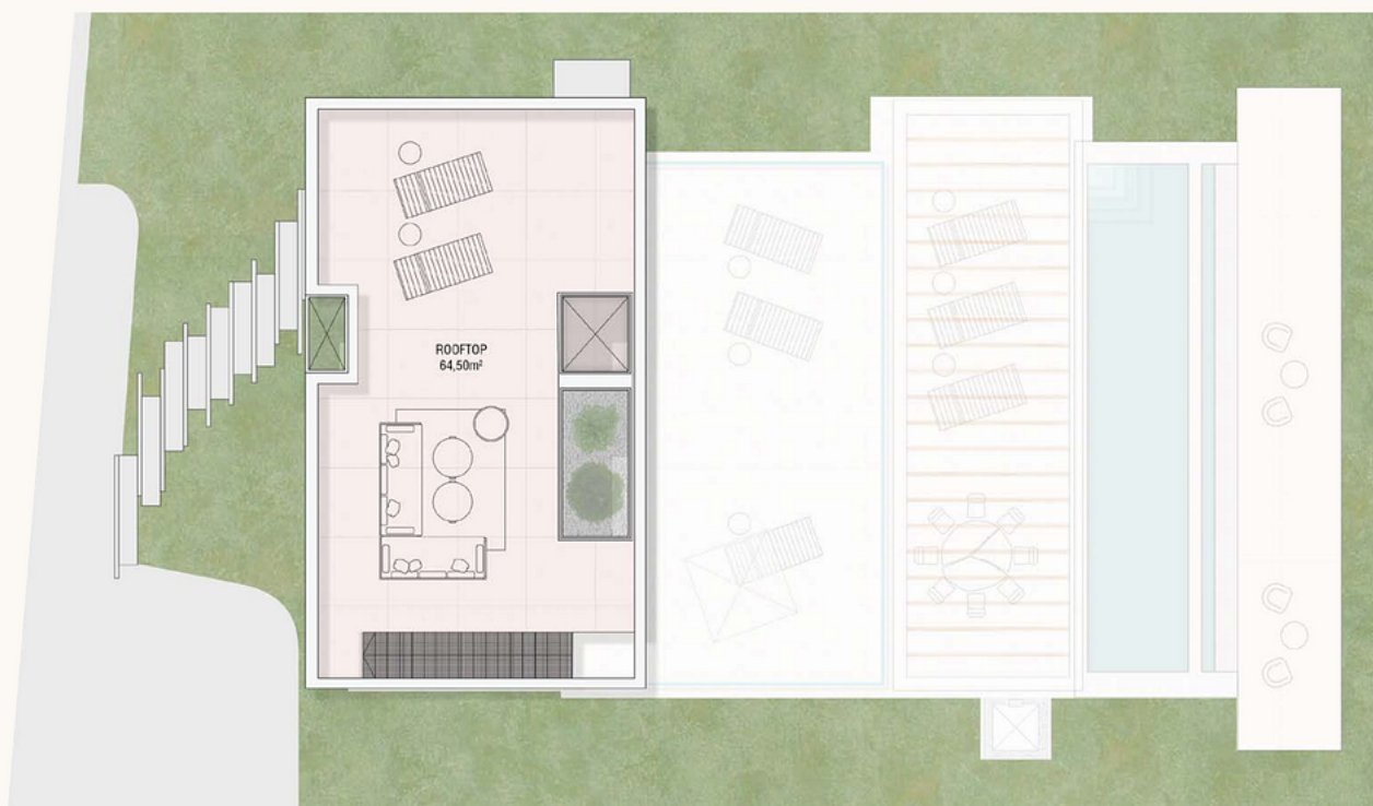
Plano de planta