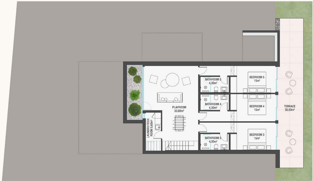
Plano de planta