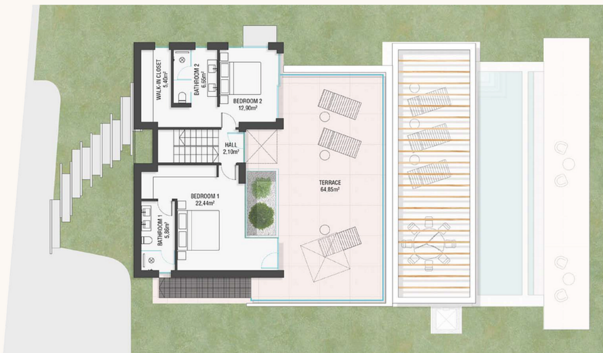
Plano de planta